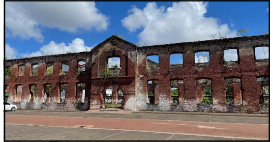
Ruïne van de garnizoenskazerne in 2023.

Het is duidelijk dat men de brandhaard van de epidemie lokaliseerde in de benedenverdieping van de kazerne naast Fort Zeelandia – het gebouw waarvan nu nog slechts een ruïne staat. 11 Ook zocht men verklaring voor de epidemie in de 'zwampen' ten zuiden van Paramaribo.