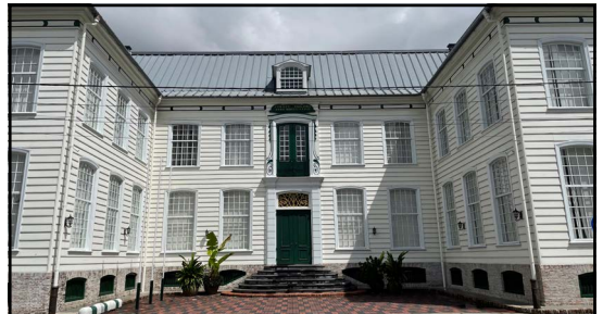
Gravenstraat huis Nepveu in 2023.

Met de verplaatsing van een compagnie van de kazerne (Fort Zeelandia) naar Loge Concordia aan de Gravenstraat nam de legerleiding overigens een groot risico: dit pand, het vroegere woonhuis van gouverneur Nepveu (tegenwoordig Henck Arronstraat 6) lag midden in de stad. Een uitbraak onder burgers lag daardoor nadrukkelijk op de loer.